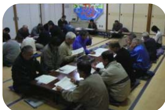
第3回 まちづくり計画策定委員会