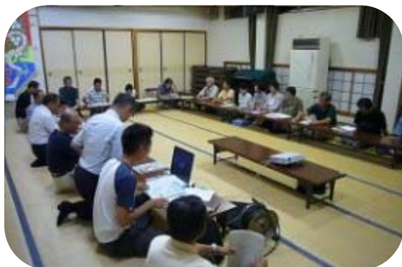
第1回 まちづくり計画策定委員会