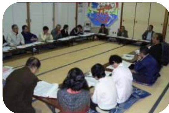
第2回 まちづくり計画策定委員会