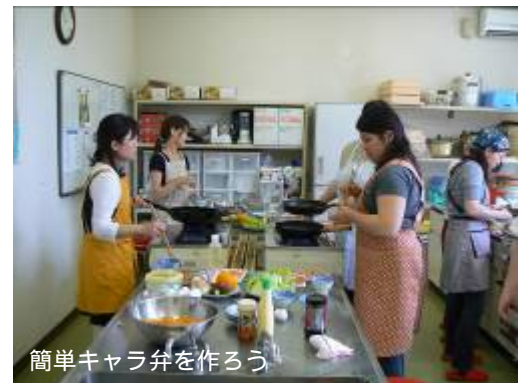
簡単キャラ弁を作ろう