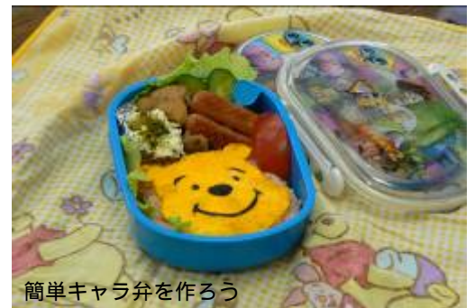
簡単キャラ弁を作ろう